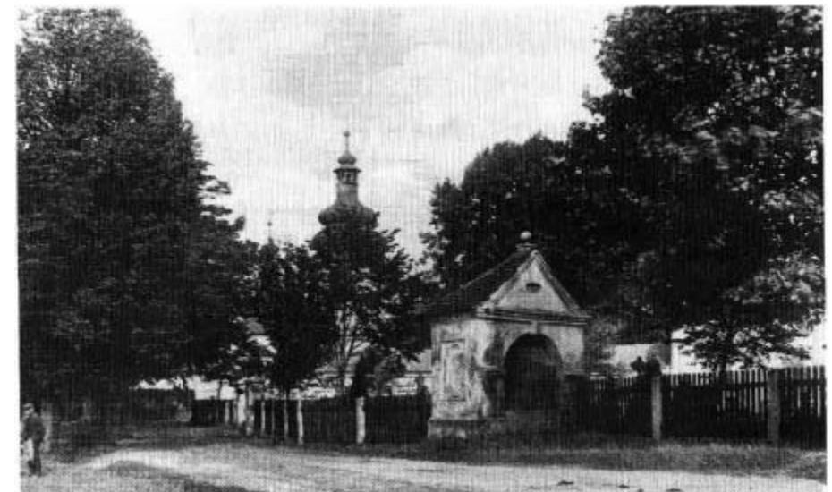
28. Station (Kreuzabnahme) mit Friedhof und Maria Loreto - alte Aufnahme