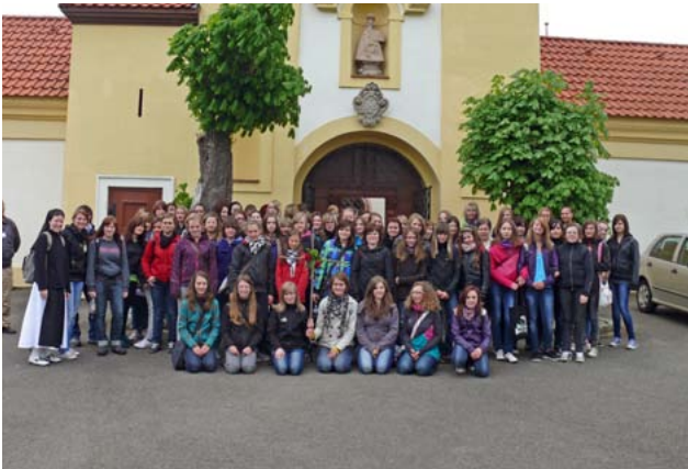
Schülerinnen der Mädchenrealschule