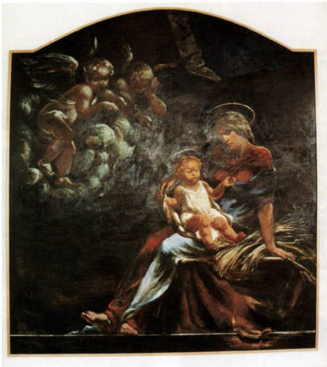
Geburt Jesu - Ölgemälde vom akademischen Maler Šindelar im Kreuzgang von Maria Loreto

Die Menschwerdung des Sohnes Gottes, die vor rund 2.000 Jahren geschah, ist Mittel- und Höhepunkt der gesamten Welt- und Heilsgeschichte. Sie wird an Weihnachten im Hochfest von Jesu Geburt mit jubelnder Freude gefeiert. Die Kirche eröffnet am Vorabend die Liturgie mit den Worten: „Heute sollt ihr wissen, dass der Herr kommt, um uns zu erlösen und morgen sollt ihr schauen seine Herrlichkeit.“