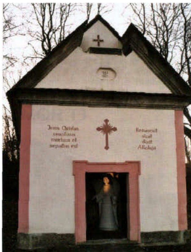
Oben: Das Heilige Grab; unten: Tafel im Hl. Grab.