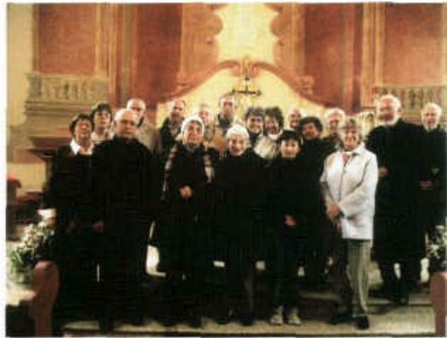
Pilgergruppe aus Bad Neustadt/Saale.