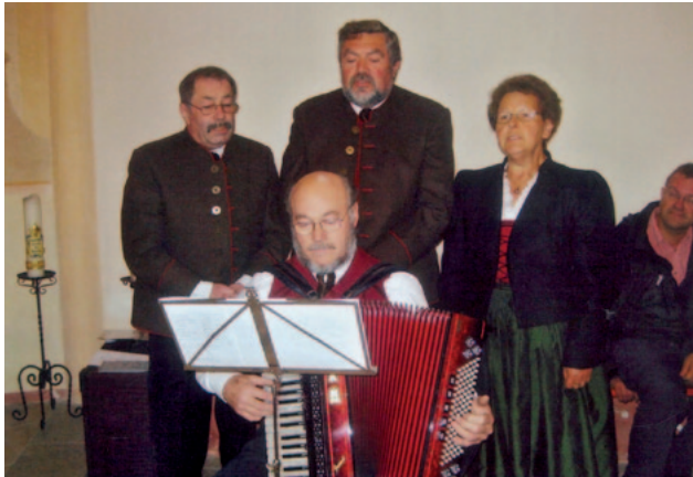
Die Vöia vom Grenzboch