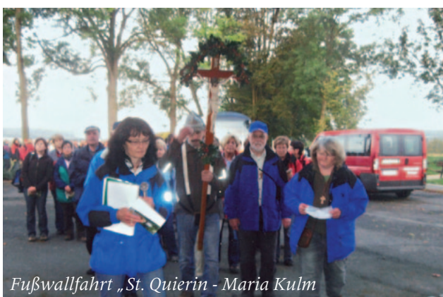
Fußwallfahrt „St. Quierin - Maria Kulm