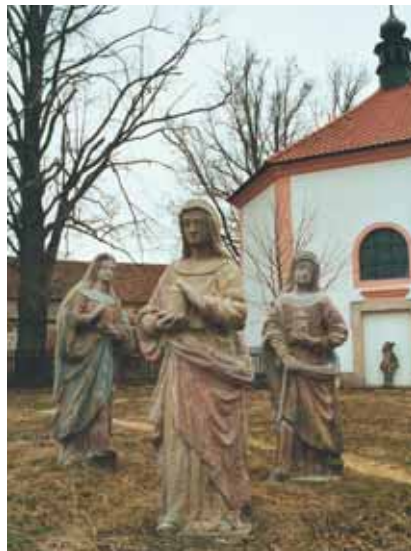
Frauen eilen zum Grab, um den Leichnam Jesu zu salben.