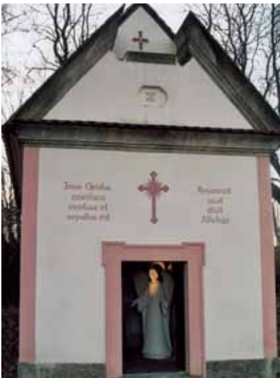
Kapelle vom Heiligen Grab mit „Engelerscheinung“