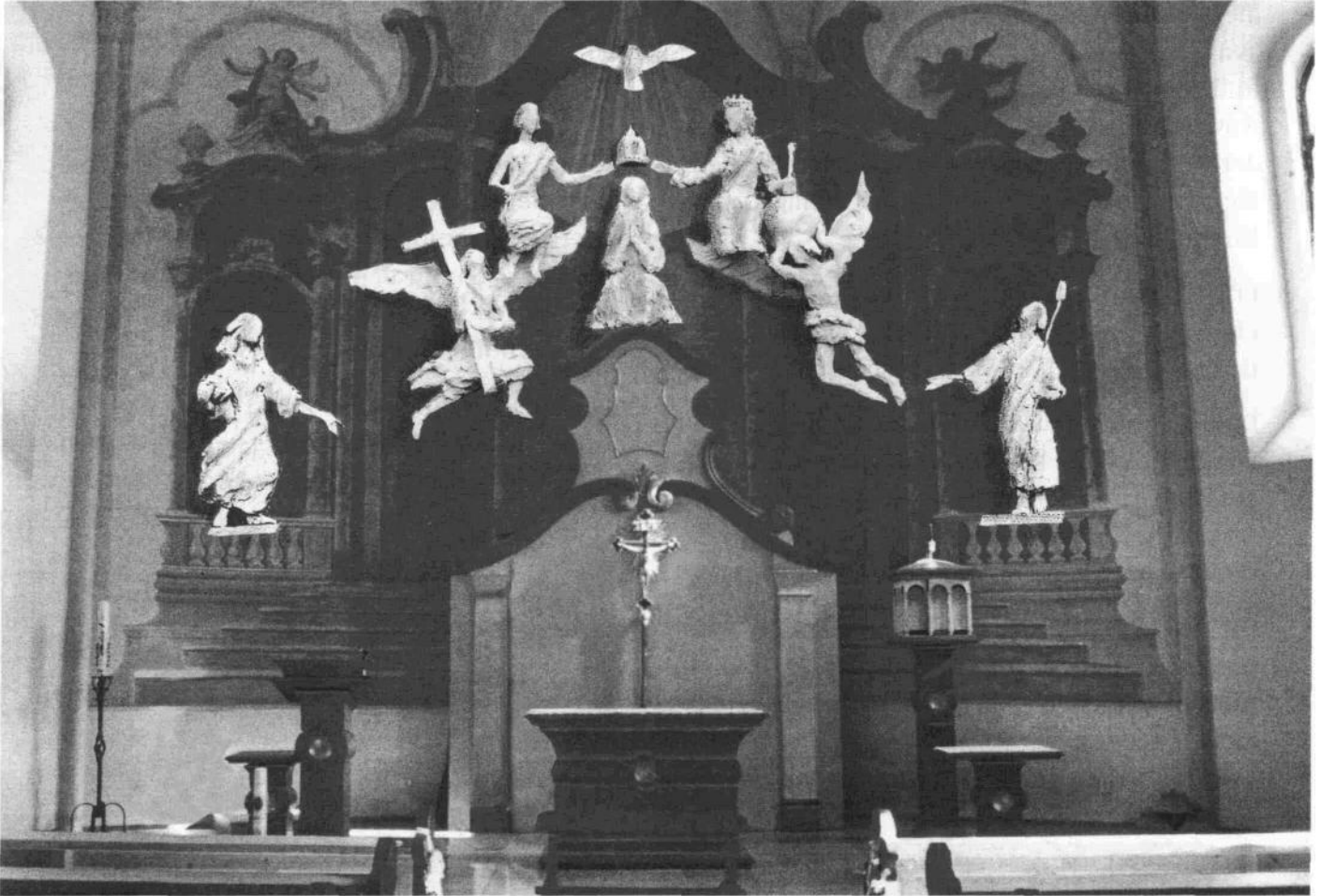
Fotomontage der Altarwand mit der Aufnahme Mariens in die Herrlichkeit des dreifaltigen Gottes