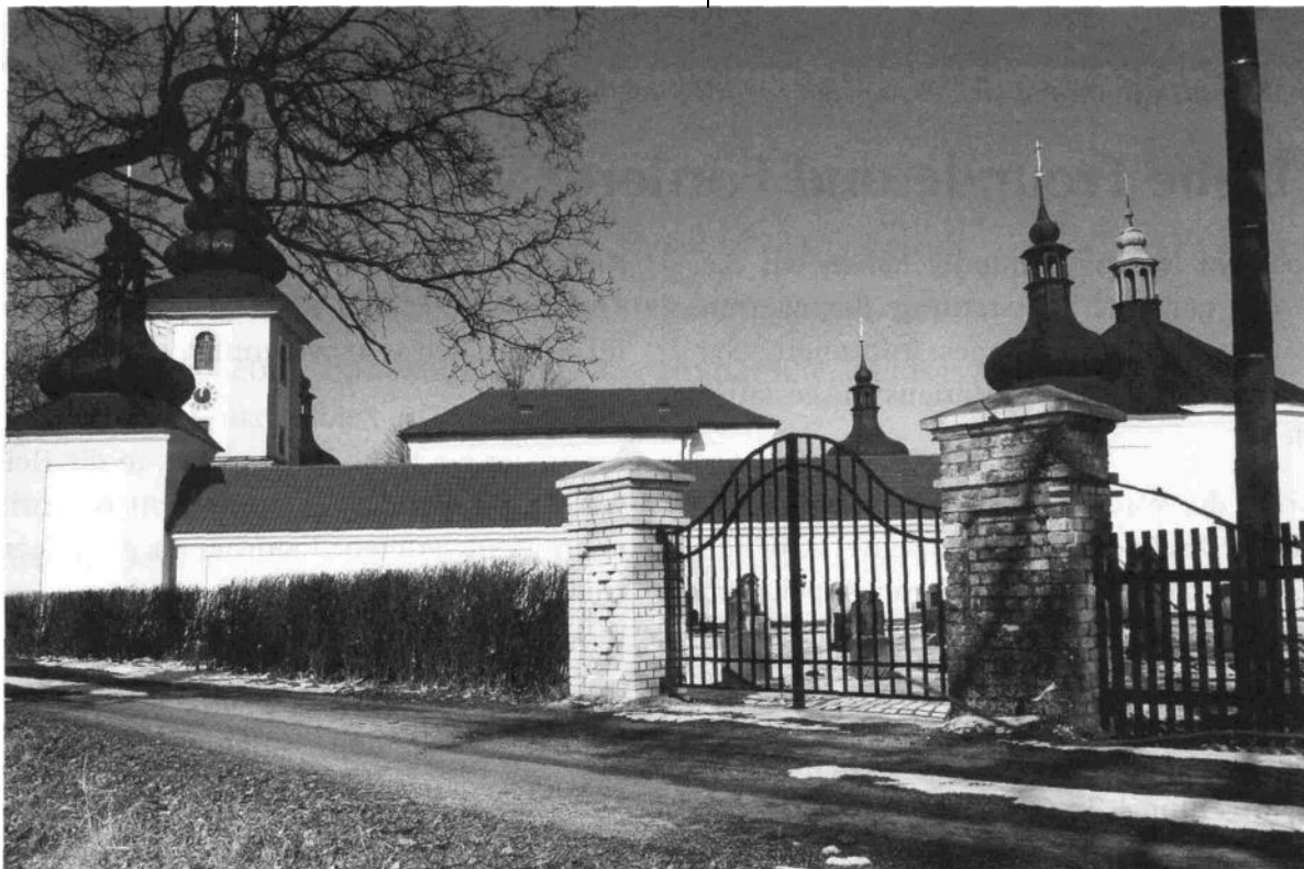
Das neue Friedhofstor von Maria Loreto