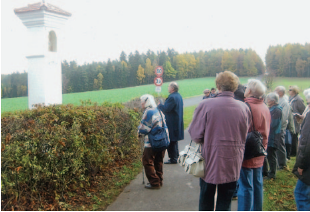
Gebet bei der letzten Station