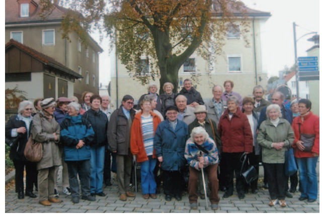
Egerer Wallfahrer am Johannisplatz