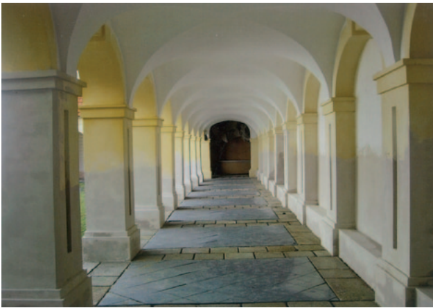
Erneuerung des Innenputzes bis zu 150 cm Höhe

Umfangreiche Ausbesserungsarbeiten insbesondere am Verputz des Mauerwerkes sind unaufschiebbar und müssen sukzessiv in Angriff genommen werden.