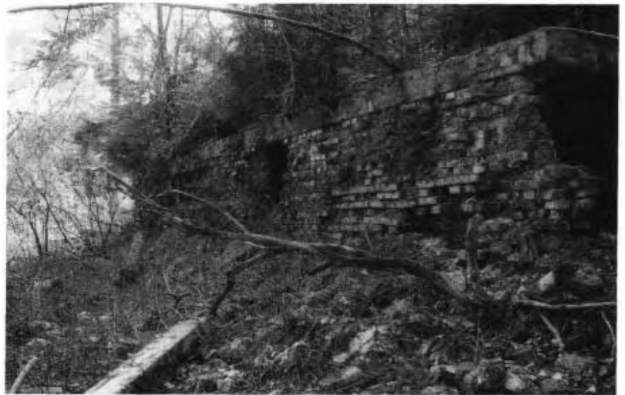
Überreste vom Forsthaus. Der halb verwitterte Keller

Nur noch Steinhäufen blieben übrig von den einstmaligen Vierseithöfen. Darauf wachsen Bäume; der Sturm hat inzwischen schon etliche umgelegt. Im Wurzelwerk dieser gefallenen Riesen stecken Mauerreste der einst stattlichen Höfe.