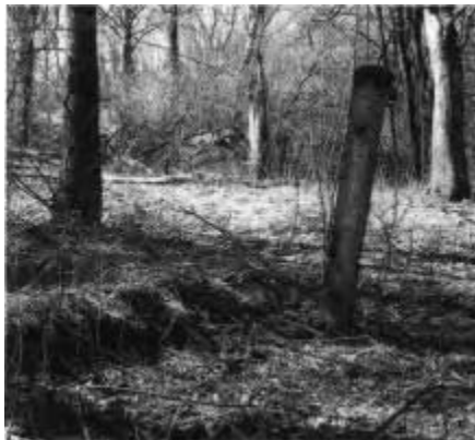
Einsam steht ein Zaunpfosten