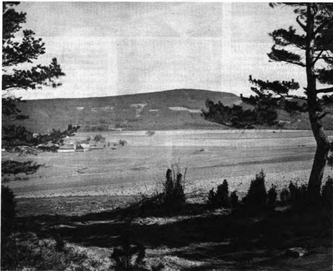
Ulrichsgrün mit dem Tillenberg