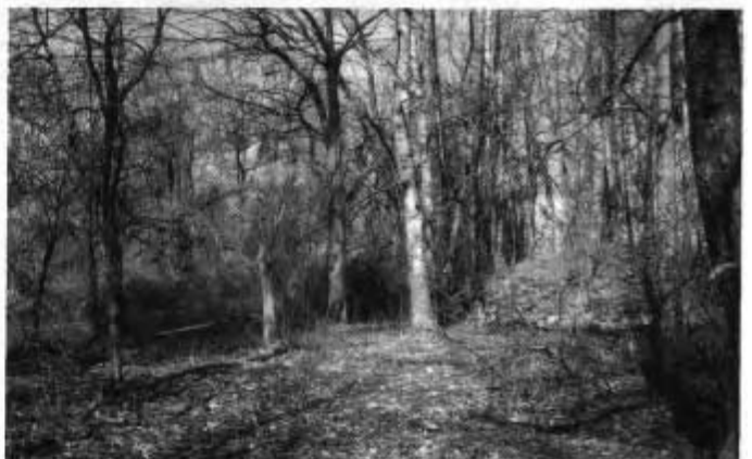
Rechts die Reste des Schulhauses, vom Zuber Theodor aus gesehen. Im Hintergrund links der Ulrichsgrüner Teich