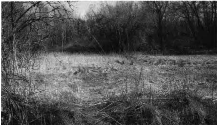
Die verwilderte „Bummelpaint“. Im Vordergrund Mauerreste aus dem Gehöft „Matzmichl“

der Gleisingermühle führt heute eine Militärstraße. Auf den Resten der Bucha- oder Brüchermühle, meinem Geburtshaus, liegen etliche vom Sturm umgeworfene Bäume, so dass kein Durchkommen mehr ist.