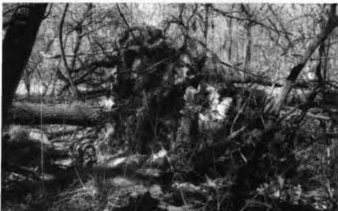
Im Wurzelwerk der umgestürzten Bäume hängt das Mauerwerk der zerstörten Häuser