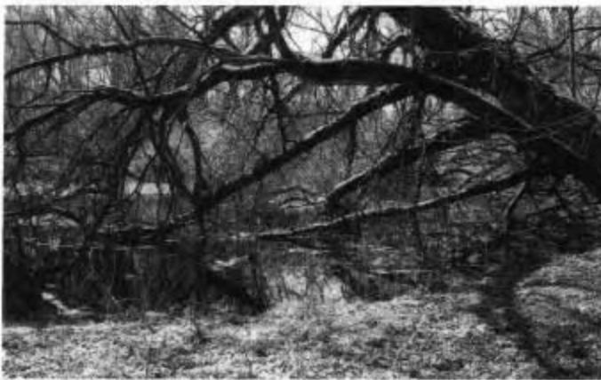
Die alte Weide am Ulrichsgrüner Teich

Die Bucha- und die Gleisingermühle sind gesprengt. Über das Grundstück