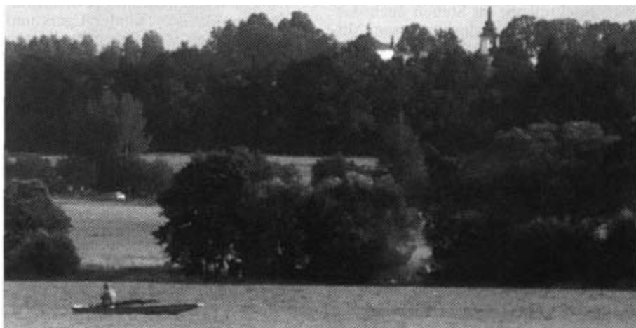
Blick auf Altkinsberg

für die Bevölkerung. Die Hütte liegt in der Nähe von Groß-Schöba, heute sagen sie Vsebor. Die einstige Bogenbrücke nach Klein-Schöba ragt noch teilweise aus dem Wasser.