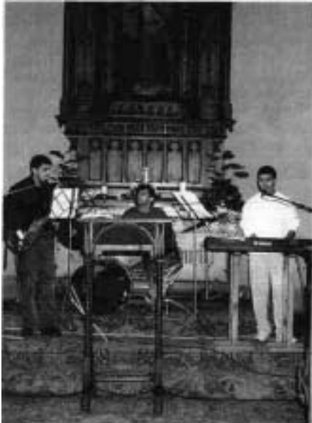
Band der Roma-Gemeinde vor dem Altar der Friedenskirche Eger