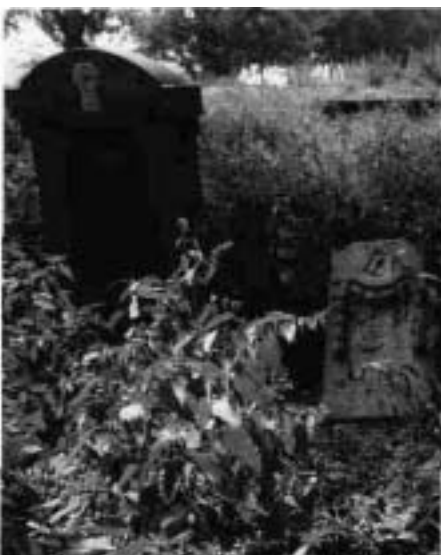
Friedhof in Palitz 1990