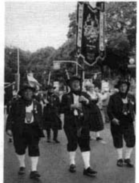
Fesche Vettern beim Unzug