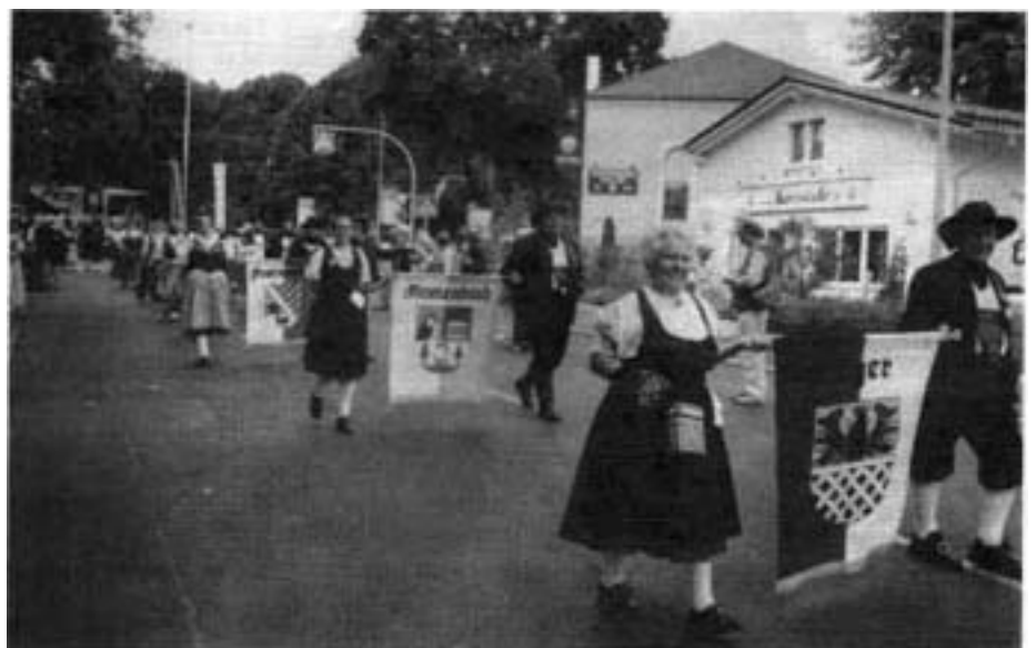
Fahnenträger mit den Wappen unseres Egerlandes