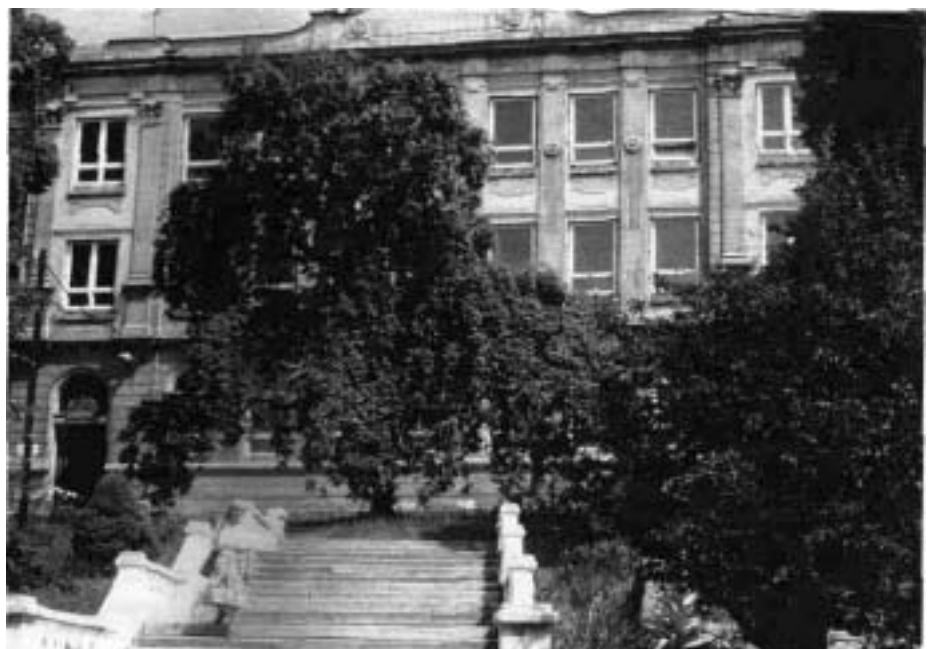
Die Bürgerschule in Schönbach

Es war im Winter, wir beide hatten schon einige Zeit Unterricht. Die Straße war wie häufig im Winter durch Schnee-Verwehungen für Kraftfahrzeuge unpassierbar. Wenn der Schneepflug nicht mehr durchkam, wurde sie manchmal von Hand freigeschaufelt. Aber meistens nach ein paar Tagen war wieder alles zu. Wir hatten regelmäßig Unterricht, zum Glück war der Schnee vorherrscht. Man konnte darauf gehen ohne einzusinken. Wir nahmen unsere Geigenkästen und gingen los. Wir hatten etwa 2 km zu laufen. Erst marschierten wir ein Stück auf der Straße, dann querfeldein, Richtung „Alter Weg“ (früherer Straße).