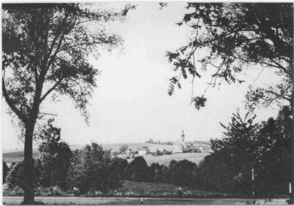
Blick vom Grenzlandturm auf die Marktgemeinde Neualbenreuth