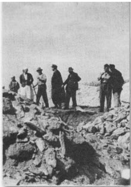
Der steinige Untergrund erschwerte und verzögerte den Fortgang der Arbeiten