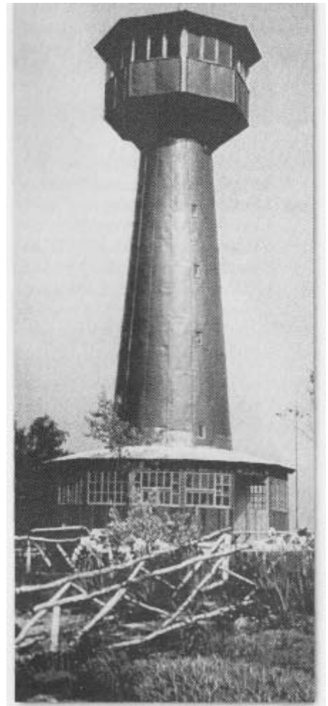
Der Turm nach Fertigstellung des Rundbaus (Warteraum und Kasse, mit Kupfer abgedeckt)

Der positive Bescheid der Gemeinde war zugleich der Startschuss für den Turmbau. Errichtet wurde er von der Baufirma Triebenbacher-Eckstein aus Waldsassen nach dem Entwurf des Mitterteicher Architekten Zeitler. Viele heimatvertriebene, aber auch einheimische Bauleute, an ihrer Spitze der Alt-