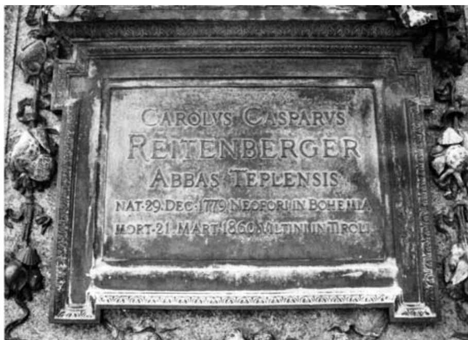
Gedenktafel für Abt Karl Kaspar Reitenberger in Marienbad