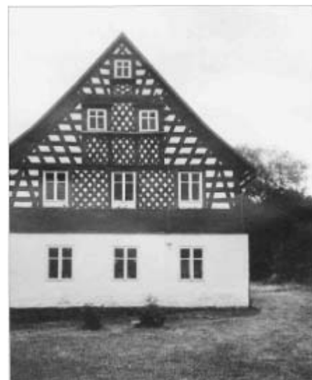
Der gleiche Hof in Palitz

Unterlosau Nr. 3 (Helm) und Nr. 5 (Sommer), im Volksmund auch als „Braut und Bräutigam“ bezeichnet. Besonders reiche Fachwerkgiebel mit Schablonenbemalung, farblich abgesetzter Überblattung und profilierten Stirnbrettern. - Die um 1845 erbauten Nachbarhöfe teilten sich einen Backofen.