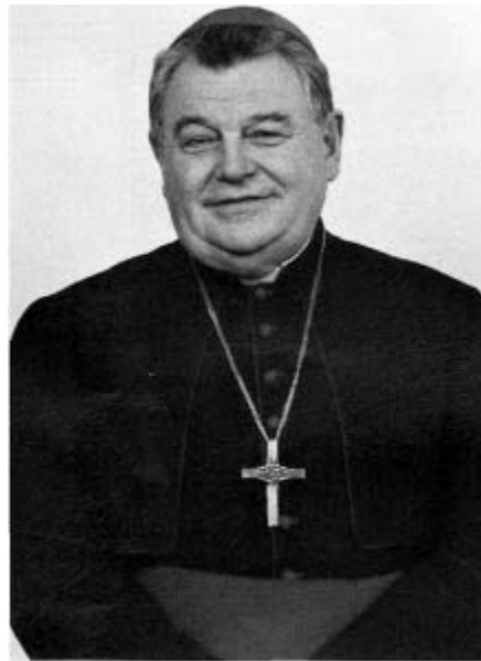
Der neue Prager Erzbischof

Neuer Erzbischof von Prag ist der 66 Jahre alte Dominikaner Dominik (Taufname Jaroslav) Duka, bisher Bischof von Königgrätz (Hradec Králove). Am 13. Februar hat Papst Benedikt XIV. den schon vor zwei Jahren aus Altersgründen angebotenen Rücktritt von Miroslav Kardinal Vlk, des bisherigen Prager Erzbischofs angenommen. Entsprechend der Tradition wurde der Name seines Nachfolgers an diesem Tag zugleich in Rom und in Prag bekannt gegeben.