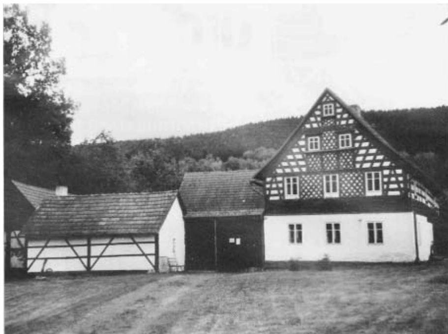
Dieser Hof steht in Palitz, links neben der Kirche

Bild Nr. 3 befindet sich schon außerhalb des alten Landkreises Eger in Unterlosau. Es handelt sich um die beiden im Heimatbuch „Denkmäler im Egerland“ auf Seite