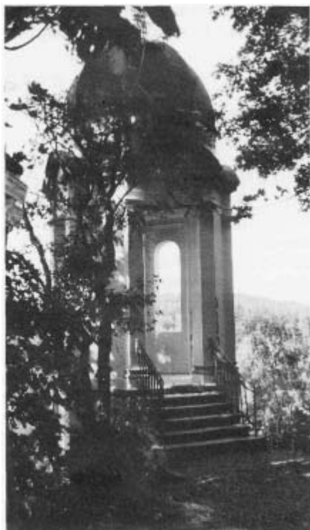
Egerwarte. Im Durchblick undeutlich der Fernmeldeturm auf dem Grünberg bei Eger.

Während links der Warte in einiger Entfernung drüben über dem Waldesgrün die oberen Stockwerke der Steiner Hochhaussiedlung her-