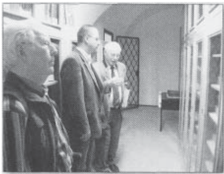
Diese Schränke enthalten das historische Gedächtnis von Eger.