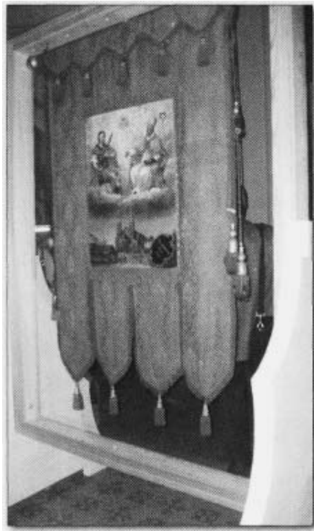
Die alte Wallfahrtsfahne. Bis 1919 wurde sie den Egerern bei ihrer jährlichen Prozession nach Marienweiher vorangetragen.

auch ihn hat Goethe sechsmal besucht -, und schließlich auch den großen Dichter selbst, Johann Wolfgang von Goethe, der sich mehrmals zur Kur im Egerland aufgehalten hat, und auch zu Besuch in Eger weilte. Diese Menschen will man den Festbesuchern vorstellen.