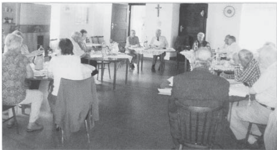
„Der Vorstand tagt...“

prüft und für richtig befunden worden. Sie stellten den Antrag auf Entlastung des Vorsitzenden und der Schatzmeisterin, dem der Vorstand auch einstimmig folgte.