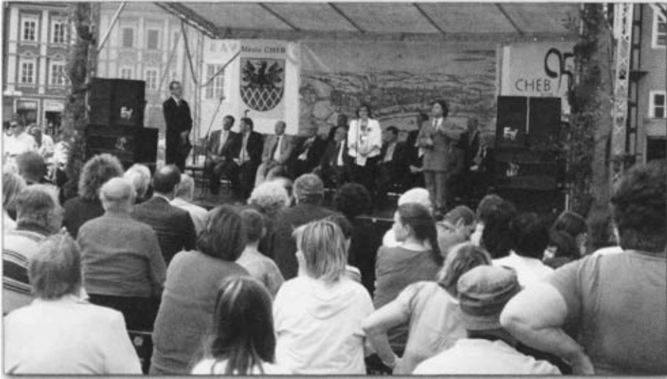
Das Festwochenende wurde im Musikpavillon auf dem Egerer Marktplatz eröffnet.