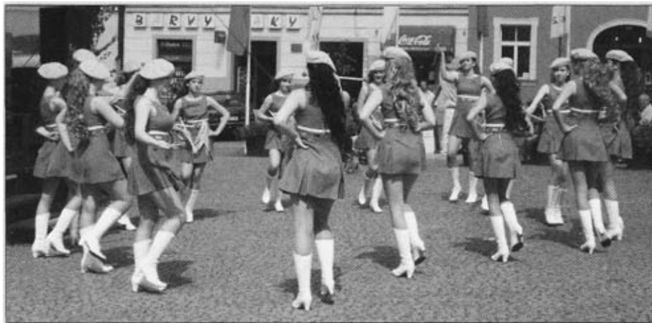
Die Mädchentanzgruppe Egerer Majoretten