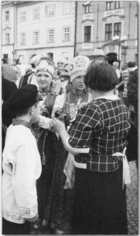
Trachten aus dem Egerland (unten) und dem Ural (rechts)