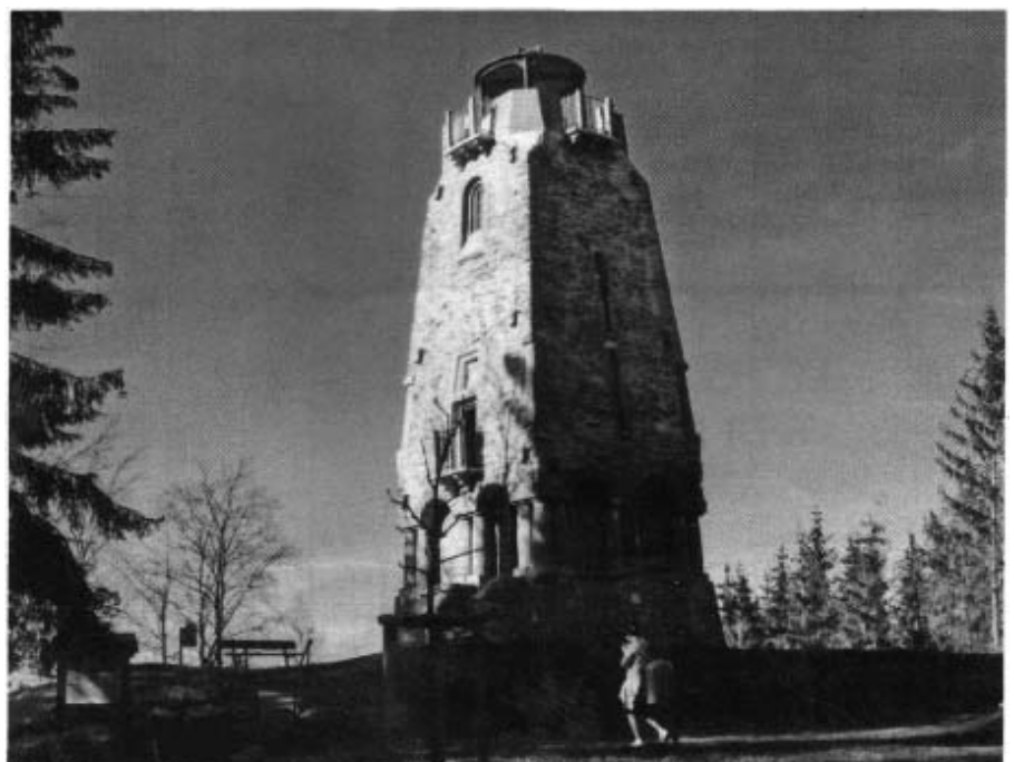
Der Bismarckturm am Grünberg

Zur Einstimmung wollte ich zunächst auf den Bismarckturm auf dem Grünberg. Es war gar nicht so einfach, die Abzweigung von der Reichsstraße aus zu finden. Auf einer etwas holprigen