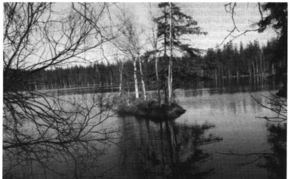
Im Naturschutzgebiet Glatzen

Am anderen Morgen war eine Fahrt ins Erzgebirge geplant. Ich wollte ein-