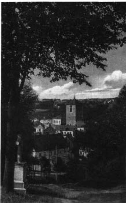
Auch dem Fotografen, der die Aufnahme für diese Postkarte machte, hatte es der Blick vom Buchnerberg auf Schönbach angetan.

Den Maler und Grafiker Karl Schreiber, von dem das Titelbild zu dieser Ausgabe stammt, stellen wir später vor. Die Stadt Schönbach, auf die er hier unseren Blick lenkt, zählt zu den alten Orten des Egerlandes. Schon um die Mitte des 12. Jahrhunderts, im Jahre 1159, wird es erstmals in einer Urkunde genannt. Aus dem Jahre 1199 erfahren wir von einem Pfarrer „Friedrich von Sconebag“. 1286 erscheint „Schonbach“ bereits im (ältesten vorhandenen) Regensburger Pfarrregister. Die Pfarrei war dem Apostel Andreas gewidmet. Sie gehörte wie der Ort zum reichsunmittelbaren Stift Waldsassen. Dieses erhob den Ort im