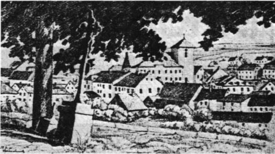
Schönbach. Zeichnung von Franz Kirschnek