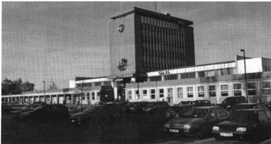
Der Egerer Bahnhof