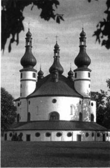
Die Dreieinigkeitskirche Kappel in Münchenreuth bei Waldsassen. Erbaut von Georg Dientzenhofer.

Die Kirche war voll besetzt, in Altarnähe standen vor allem die Kleinkinder mit ihren Eltern, die Christusfigur war rundum mit frischen Blumen geschmückt und ein langes Seil führte hinauf zur Kuppel. Der Pfarrer hielt eine großartige Predigt, wobei er besonders den Missionsauftrag der Kirche in den