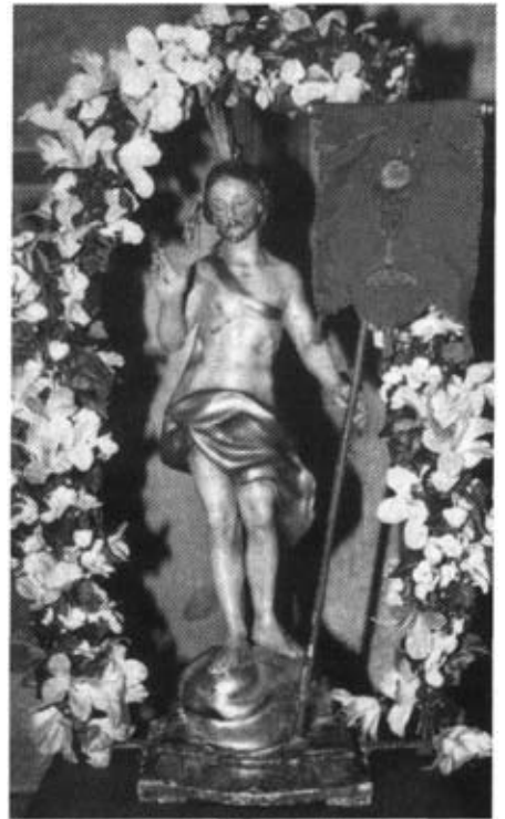
Die kleine Christusfigur, die alljährlich am Fest Christi-Himmelfahrt in der Kappel in den Kirchenhimmel „auf-fährt“.

Nach 80 Jahren lockte es mich, wieder einmal zu Christi-Himmelfahrt zur Kappel zu wallfahrten um zu sehen, wie dieses Fest heute dort zelebriert wird.