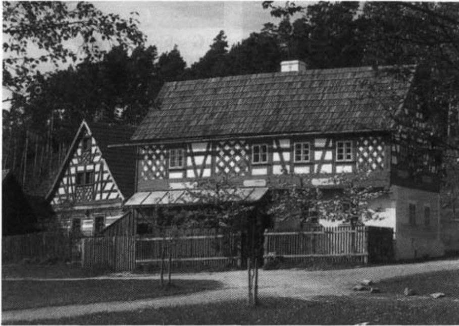
Weberhaus, früher Neualbenreuth

In der „Amberger Zeitung“ vom 21. Juni 2005 fand sich folgender Bericht: