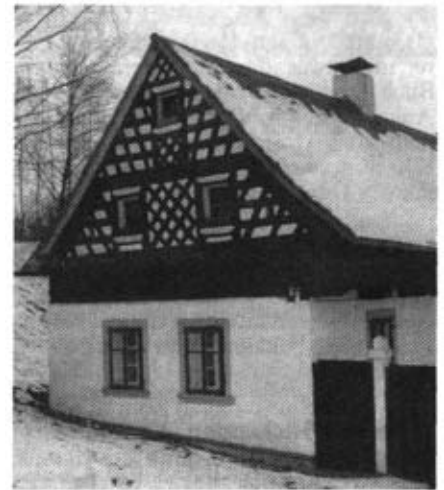
Ehemaliger Bauernhof mit Fachwerk giebel im westböhmisches Städtchen Wildstein.