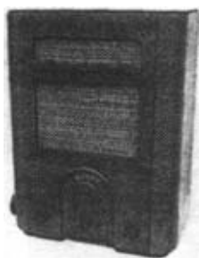
Der Volksempfänger bet, damit das nicht wahr wird, was die Himmelmutter gesagt hat.“