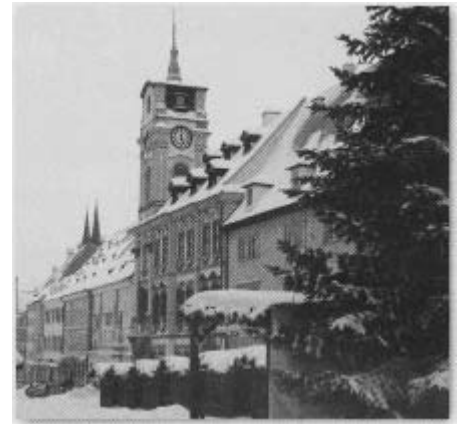
Auf dem oberen Markt, ebenfalls tief im Schnee, stehen noch der Christbaum und Buden vom Adventsmarkt.

Bei so viel winterlicher Schönheit war es kein Wunder, dass der Weg bis zum Pachelbelhaus etwas länger gedauert hat.