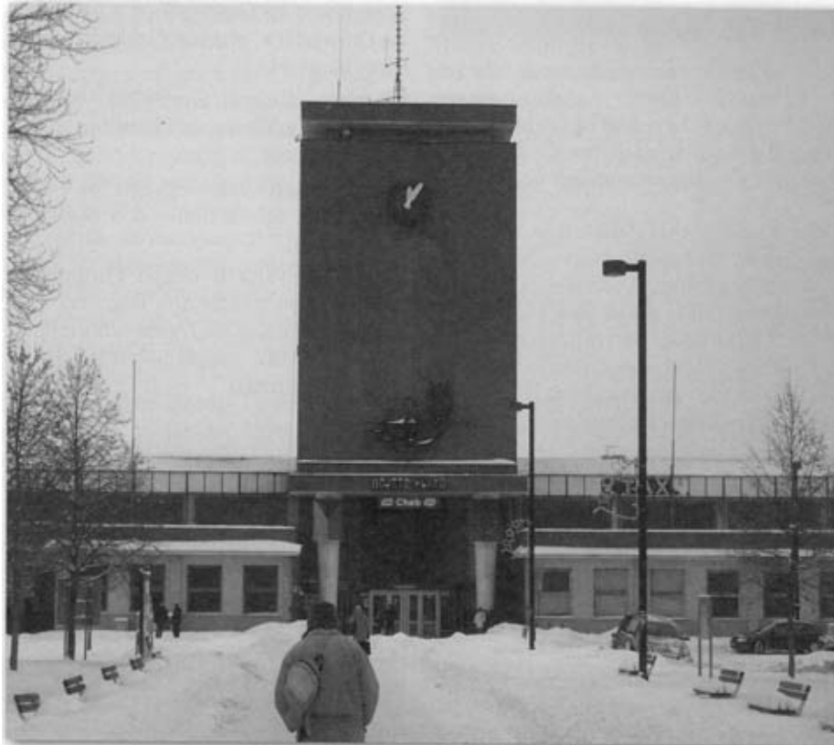
Eger. Sobald man aus dem Bahnhof trat - überall tiefer, weißer Schnee.