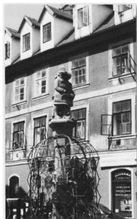
Der Zunftbrunnen in der Steingasse

Der Zunftbrunnen an der Ecke Fluth-/ Untere Steingasse in Eger wurde 1926 von Johann Adolf Mayerl zur Erinnerung an das Egerer Gewerbe entworfen. Dargestellt sind Meister, Geselle und Lehrling auf einer Mittelsäule, darunter Reliefs verschiedener Zunftzeichen,