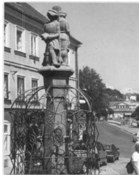
Der Zunftbrunnen mit Blick hinunter zur Egerbrücke.

eingelassen in ein kunstgeschmiedetes Gitter. Einige Reliefs sind heute verloren. (Kunst in Eger)