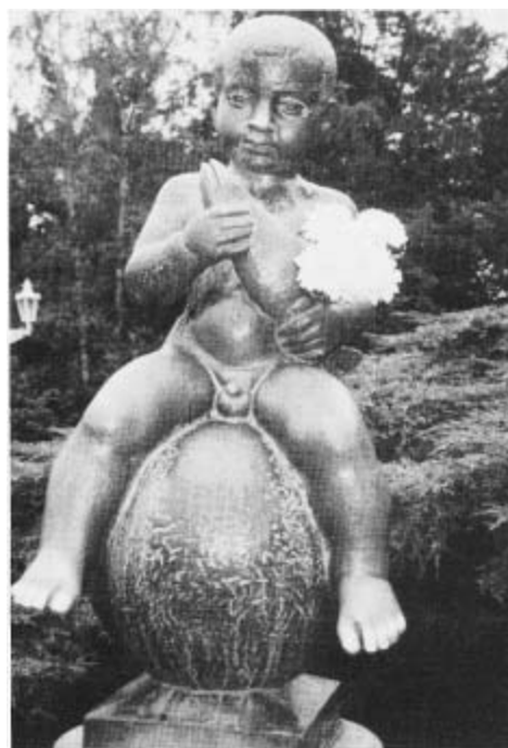
Die dritte Version des Franzensbader „Buberl"

Heute steht dort schon die dritte Bronzeplastik der Bildhauer Kozak und Ledr.