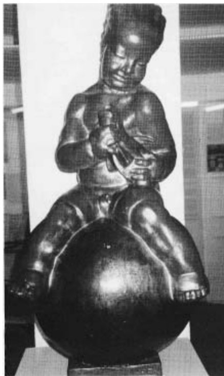
Das Original des Buberl kam um 1965 ins Museum