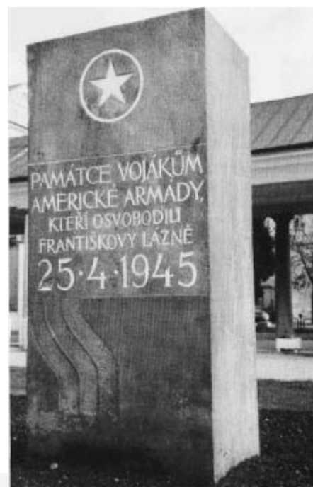
Das Befreiungsdenkmal in der Goethestraße