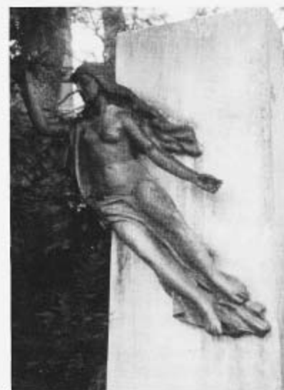
Das Denkmal für die amerikanischen Soldaten in der Goethestraße