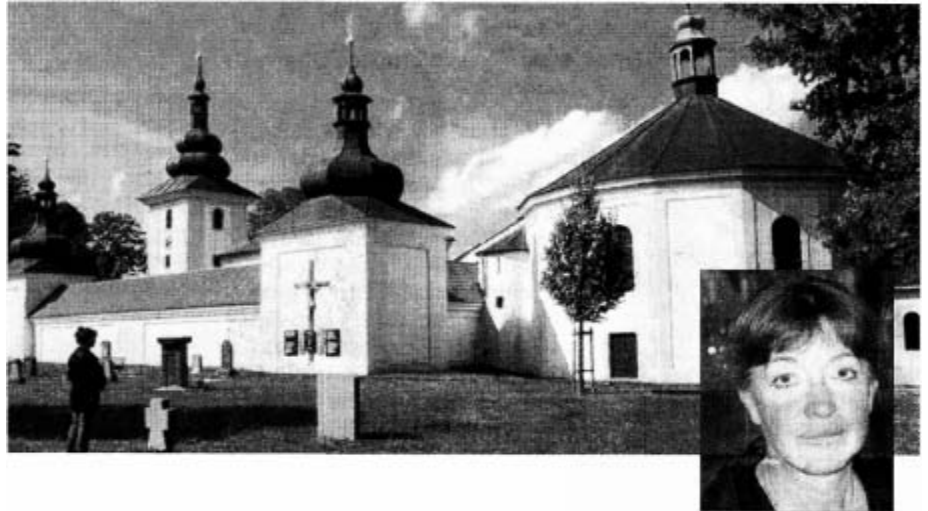
Stattliche Anlage: Maria Loreto.