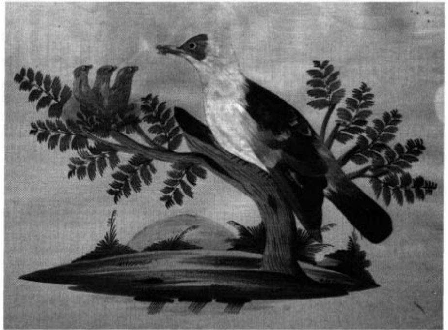
Fütternder Vogel mit drei Jungen im Nest, aus gefärbten Federn geklebt. Egerer Federbild, Mitte des 19. Jahrhunderts Heimatband Volkskunst, Abb. 257 (Privatbesitz)

Beschäftigt wurden vor allem Frauen. Der Verdienst lag bei 50 bis 80 Kreuzern am Tag. Verkauft wurden die Egerer Federbilder von Hausierern und von Händlern, die sie nicht nur auf Jahrmärkten vertrieben; Egerer Federbilder wurden damals in viele Länder verkauft, sogar bis nach Ägypten und in die