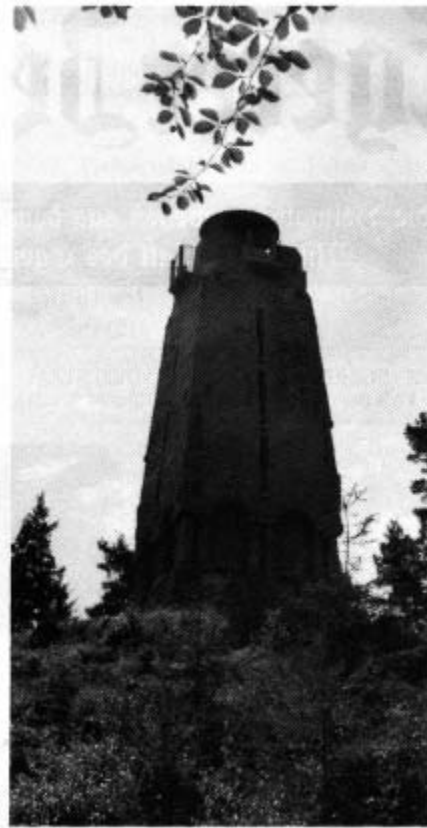
Bismarckturm auf dem Grünberg, 638 Meter, Gemeinde Oberpölmersreuth, von dem man einen weiten Überblick ins historische Egerland hat.

Heute stellt sich die Frage, was der Grund und die Ursache zum Bau des Bismarckturmes war. Eger war im 19. Jahrhundert wiederholt die Stätte nationaler Kundgebungen. In dieser Zeit