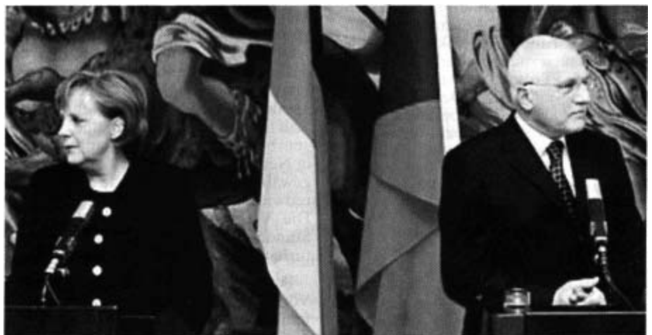
Bundeskanzlerin Angela Merkel und Präsident Vaclav Klaus bei ihrem Besuch in der