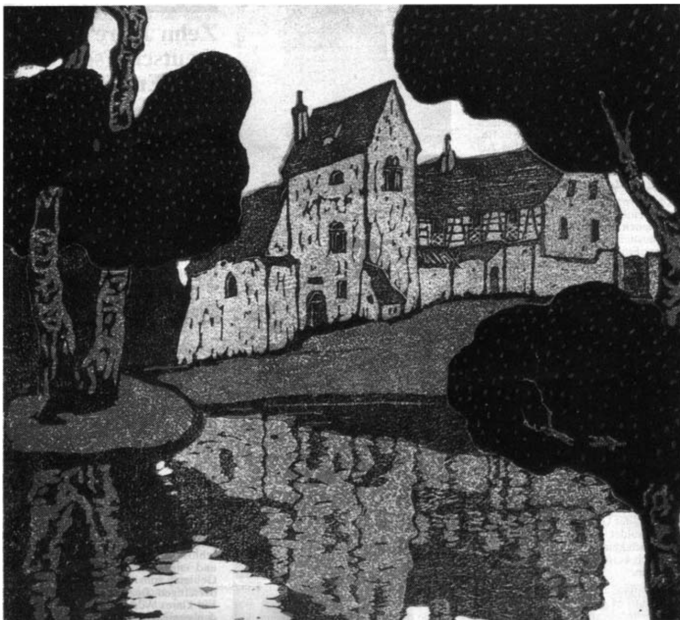
Walther Klemm Schlösschen Watzkenreuth bei Eger Farbholzschnitt von 1908