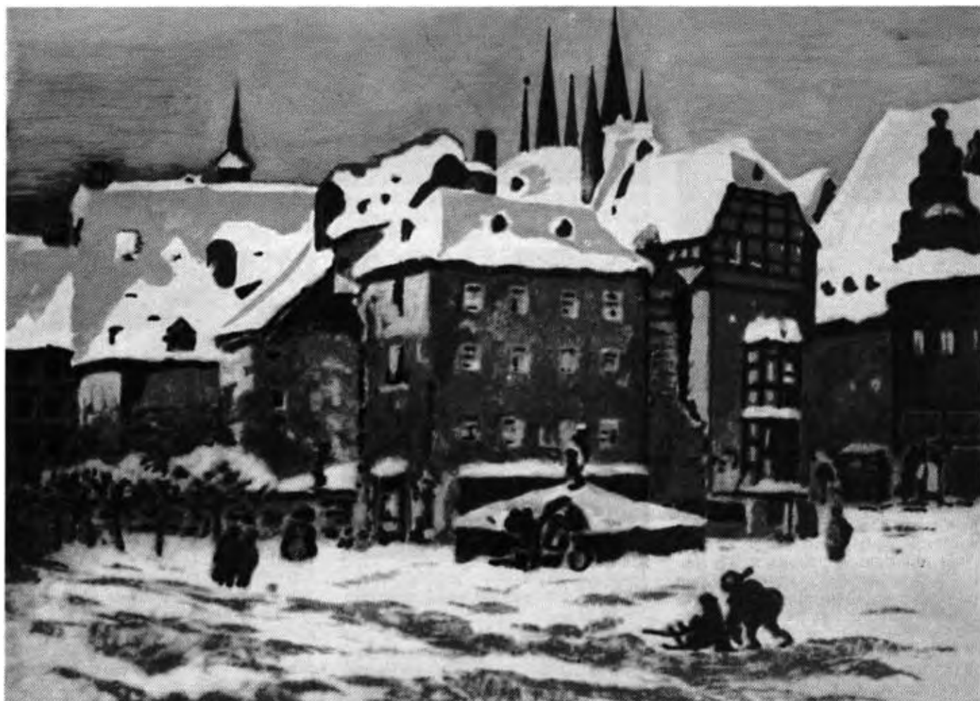
Verschneiter Marktplatz in Eger