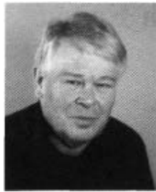
Liebe Leserinnen und Leser, liebe Landsleute!