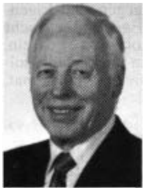
Grüßwort des Vorsitzenden des Egerer Land- tags e. V.

Liebe Leser, Wenn Sie die De- zember-Ausgabe der Egerer Zeitung in Händen halten, ist Weihnachten, und das Jahresende