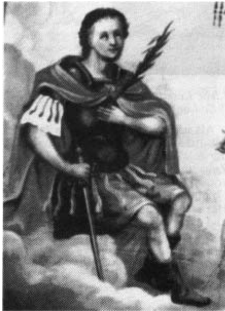
Hl. Vinzenz, Schutzpatron Egers. Detail aus der Egerer Wallfahrtsfahne von 1865.

Danach setzte sich die Prozession, die durch die wichtigsten Gassen führte, in Bewegung. Die Spitze des Zuges bildeten die Schüler der deutschen Schulen, darauf folgten die Eingepfarrten der Dorfschaften Albenreuth, Treunitz, Lohma, Trebendorf, Nebanitz, Mühlbach, Frauenreuth und Mühlessen. Hinter der lateinischen Kongregation der Gymnasiasten mit Fahne und Marienbild kamen die Stadt- und Kirchenmusiker und die Ordenspriester. „Nach diesen Religiösen folgten vierzig schön gekleidete Knaben, vier und vier, in deren Mitte die Statuen des Hl. Niklas und der Hl. Elisabeth, als Patronen der Pfarrkirche, getragen wurden, darnach die Kuratgeistlichkeit im Kirchenornate und darnach der Reliquienkasten mit dem Hl. Leichnam, von acht Priestern getragen, welchem der Stadtmagistrat, der Adel, die Bürgerschaft, Bruderschaften und endlich die übrigen andächtigen Teilnehmer des Umganges folgten.“ Die