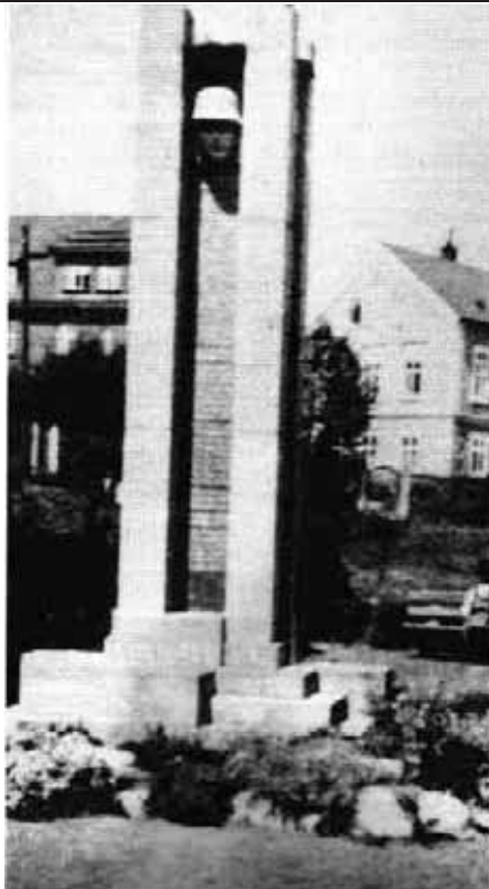
Kriegerdenkmal in Trebendorf 2003

und wobei nahezu die gesamte Hausfront noch deutsch beschriftet war. Irgend ein deutscher Betrieb war hier angesiedelt; ich weiß natürlich nicht mehr welcher. Jedenfalls, meine Suche war umsonst, ich fand dies Gebäude nicht mehr und fuhr mehrmals „für die Katz“ hin und her. Sei es drum, hab' ich wenigstens die schöne Landschaft gesehen.