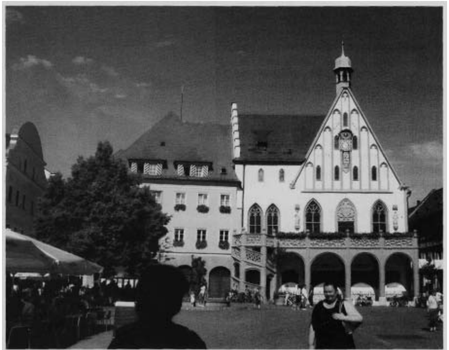
Das Amberger Rathaus