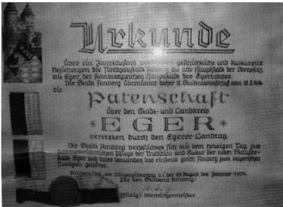
29. August 1954 - Die Stadt Amberg übernimmt die Patenschaft über die Egerer. - Seit fünfundsünfzig Jahren ist Amberg unsere Patenstadt.