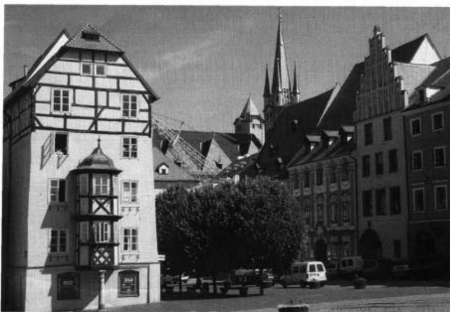
Eger. Die Türme der Stadtpfarrkirche während der Renovierung ihrer Dächer. Der südliche Turm trägt schon die neue (und alte) neugotische Spitze mit Schieferdeckung, während der Nordturm noch das bisherige „Behelfsdach“ aus der Nachkriegszeit trägt.