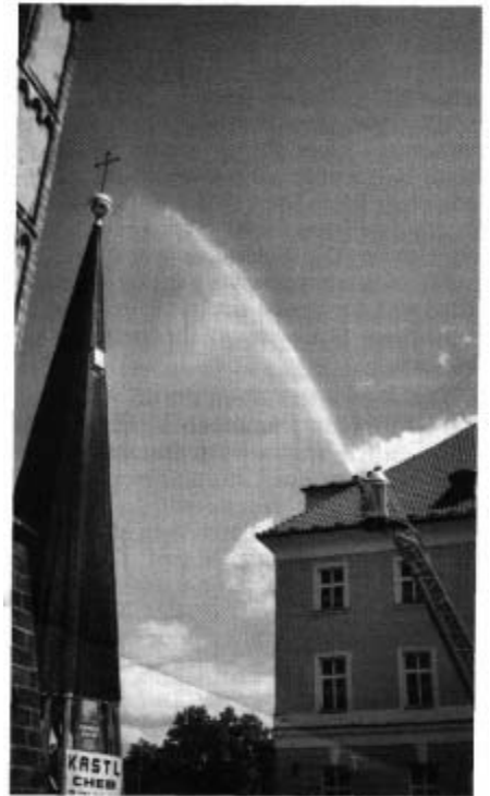
Pfarrer Bauchner fuhr auf einer Feuerwehrleiter neben der Turmspitze empor und weihte diese in ihrer ganzen Höhe. Ein Feuerwehrmann „verstärkt“ mit einem Druckschlauch die Wirkung - zumindest optisch.