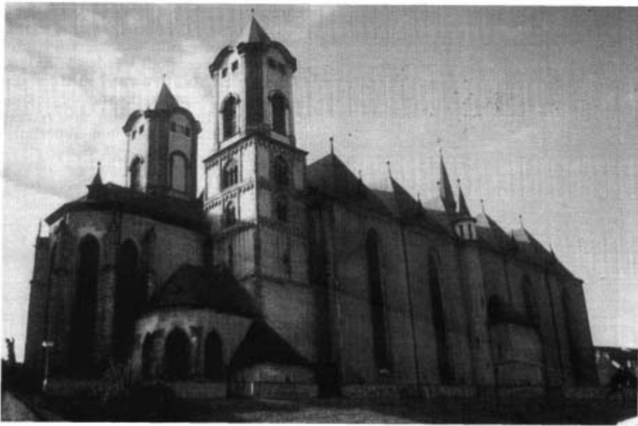
Eger. St. Niklas nach 1945. Ansicht vor der Renovierung im Juni/Juli 2008 vom Kasernplatz aus. lang. (L. Schreiner, Kunst in Eger, S. 1239)

Durch die hohen Kosten für diese Studien und den Innenausbau blieb jedoch kein Geld mehr für die Erneuerung der nördlichen Turmspitze und der Fassade. Erst Ende 1865 konnten diese Arbeiten fortgesetzt werden. Der aus Königsberg an der Eger stammende Zimmermann und Baumeister Kaspar Jager fertigte und montierte die bis dato fehlende nördliche kegelförmige Turmspitze.