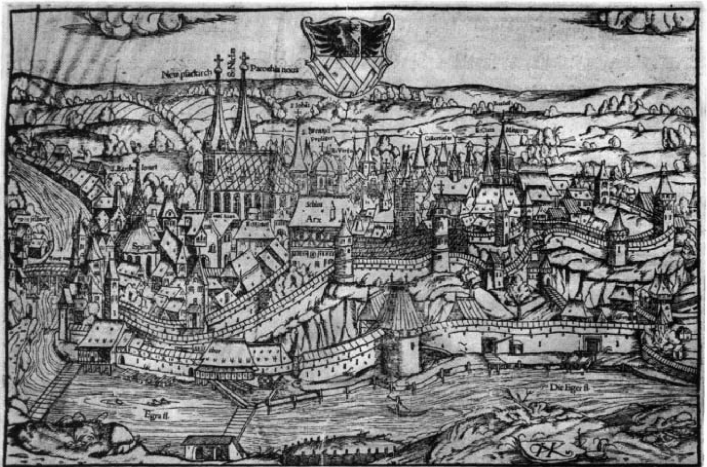
Eger. Stadtansicht aus der Mitte des 16. Jahrhunderts. Holzschnitt von Caspar Hofreuther für die Kosmographie von Sebastian Münster. (Sturm, Eger, Bildband, S. 260)

Bekannt ist, dass bei einem großen Brand im Jahr 1270 neben vielen Häusern der Stadt auch die Kirche in Mitleidenschaft gezogen wurde und dabei auch die Türme großen Schaden nahmen. Erst um 1350 sind die Türme wieder aufgebaut worden. Das Kirchenschiff war nur notdürftig restauriert. Der deutsche Ritterorden mit dem roten Kreuz, dem die Verwaltung der Kirche unterstand, hatte die vorhandenen Geldmittel für den Neubau der Kommandekirche St. Bartholomäus am Brucktor verwandt, so dass für die eigentliche Stadtkirche kaum etwas übrig blieb. Erst um die Mitte des 15. Jahrhunderts war es durch eine großzügige Stiftung möglich, an die Rekonstruktion der Stadtkirche heran zu gehen. Der