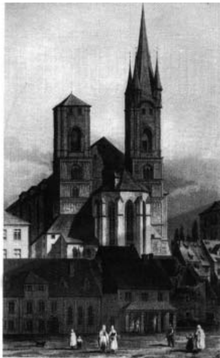
Die St.-Niklas-Kirche nach dem Aufbau des Südturmes 1812. Stahlstich von Ch. Rosee. (Egerland-Museum). (Sturm, Eger, Bildband, S. 112)

Gut 250 Jahre ragten die schlanken Kirchturmspitzen in den Himmel. Sie wurden oft skizziert und weithin bestaunt.