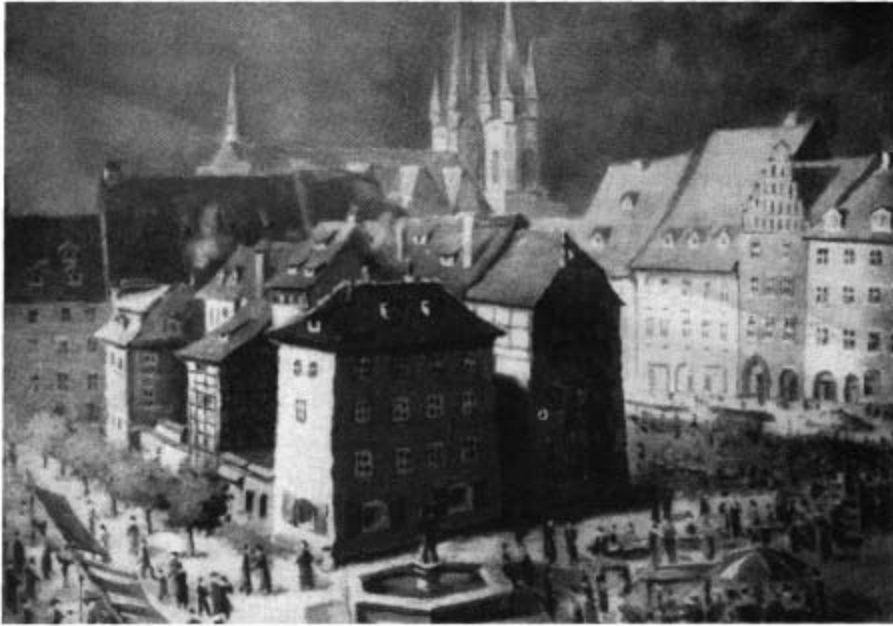
Eger. Unterer Marktplatz mit dem Stöckl. Rechts dahinter die Stadtpfarrkirche, deren Türme bereits die hoch aufragenden gotischen Spitzen tragen. (Sturm, Eger, Bildband, S. 231)

Der Bau der großen katholischen Stadtkirche von Eger geht auf die Zeit des frühen 13. Jahrhunderts zurück. Die in der Nähe der Burg gelegene Johannes Kirche war vermutlich zu klein geworden, so dass man sich entschloss, einen größeren Neubau zu errichten. Der Bauzeit entsprechend entstand ein romanischer Bau, der vermutlich im Jahre 1220 geweiht wurde. Die Rundbögen im unteren Teil der Türme an der Ostseite weisen auf den romanischen Stil dieser Zeit hin. Wie die Turmspitzen ausgesehen haben, ist nicht bekannt. Sicherlich trugen die Türme noch keine hoch aufragenden Kegelspitzen, denn das ist ein Stilmittel einer späteren Zeit.